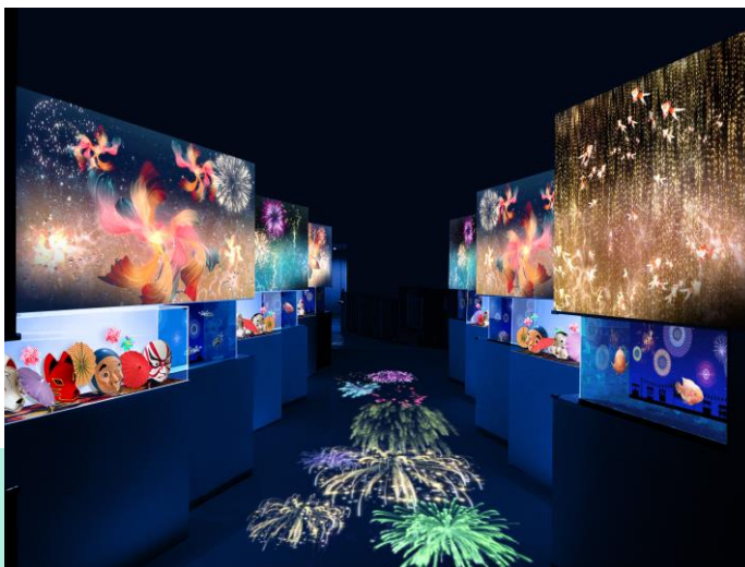
「祭り花火 ※イメージ」