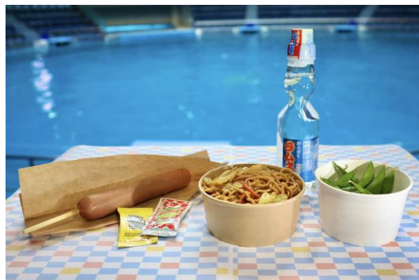
※メニューイメージ