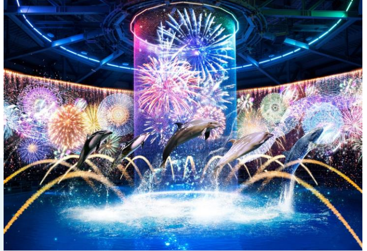
「瑠璃花火-Digital Fireworks- ※イメージ」

MCを入れず【水(噴水、ウォーターカーテン)】・【光(ムービングライト、水中照明)】・【映像(プロジェクションマッピング)】・【音(12.1chサラウンド)】などの最先端テクノロジーを用いた演出のみで展開。イルカたちの躍動と連動するように会場一面に美しいデジタル花火が次々と打ちあがります。目前で繰り広げられる“海の世界の花火大会”で圧倒的なイマーシブ(没入型)体験を提供し、皆さまを情緒的な夏の夜へと誘います。