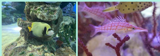
左:“縦縞”とリンクする「タテジマキンチャクダイ」 右:“網目”の模様を持つ「クダゴンベ」