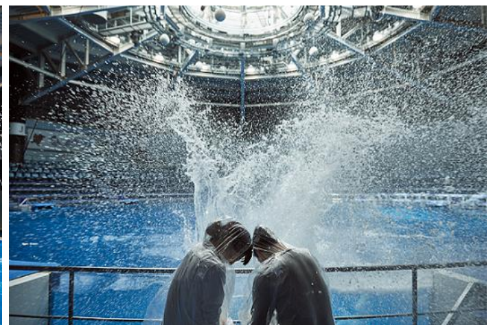
「Dolphin Summer Carnival ※イメージ」